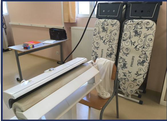
1 salle de linge : centrales vapeurs, calandres, etc.